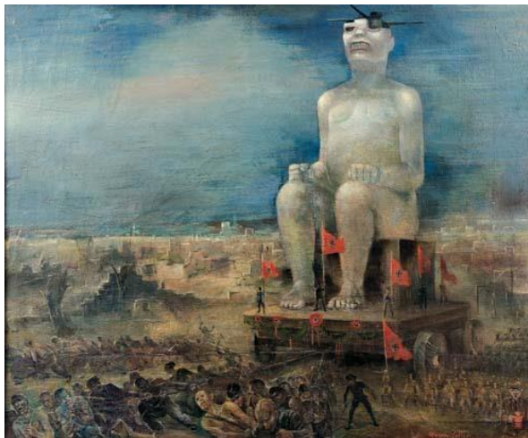
“Juicio al Fascismo” (detalle) de “Retrato de la burguesia”, David Alfaro Siqueiros, Antonio Pujol, Luis Arenal, Josep Renal e Antonio Pietro (1939), Sindicato Mexicano de electricistas, Ciudad de México. “Der Hitlerstaat” (“Der totale Staat”), Magnus Zeller, Caputh 1938/1945, Berlin, Stiftung Stadtmuseum Berlin.